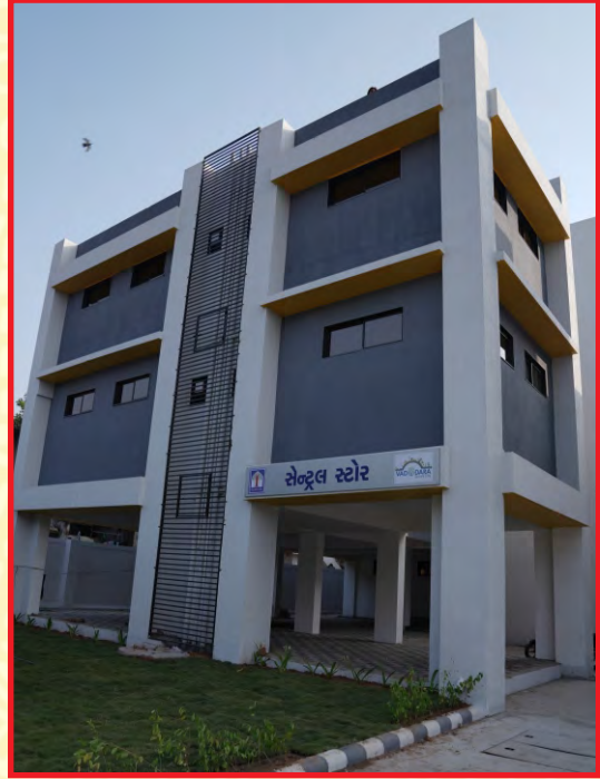
નવીન સેન્ટ્રલ સ્ટોરની કચેરી