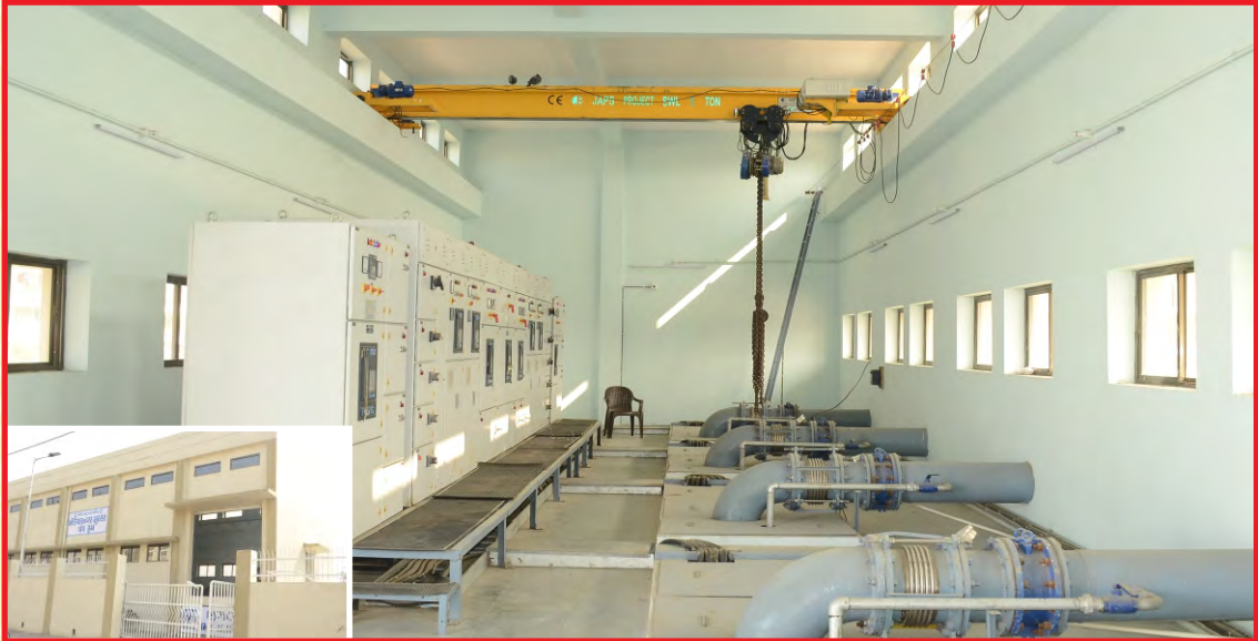
નવન ખોડિયારનગર બુસ્ટર પંપ રૂમ