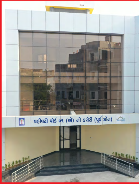
નવીન વહીવટી વોર્ડ - ૧ (એ) ની કચેરી